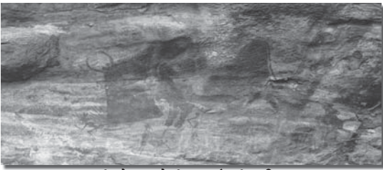
भीमबेटका येथील गुहांमधील चित्र.